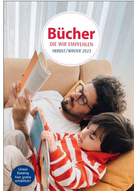
PLAKAT (1 Exemplar) Format: 42 cm x 59,4 cm