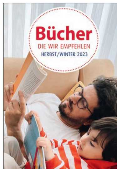
BUCHSTECKER (100 Exemplare) Format: 7,4 cm x 10,5 cm